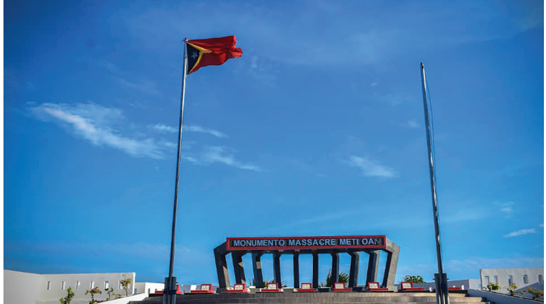
Fatin istóricu ida iha Munisípiu Manufahi Monumento Massacre Meti Oan, Wedauberek, Alas