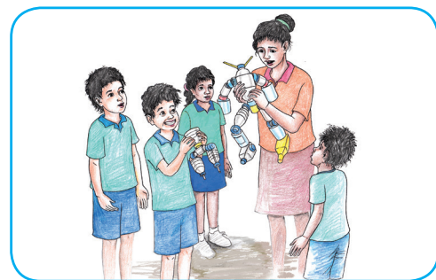
Pájina 9 Resiklajen