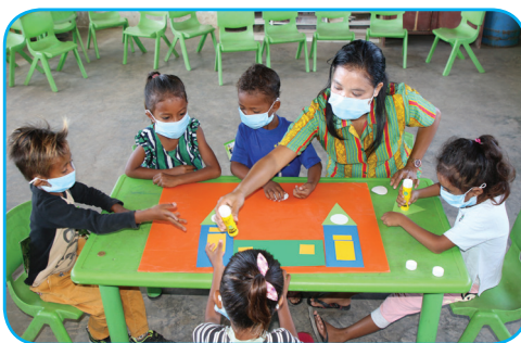
Pájina 6 Matemátika