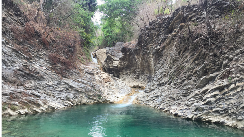
Fatin furak ida iha Munisípiu Ainaro Bee tudak, Nunumoge