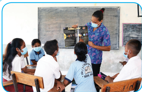
Pájina 4 Istória Susesu