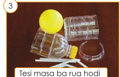
Tesi masa ba rua hodi halo elikópteru nia isin-lolon.