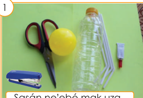
Sasán ne'ebé mak uza.