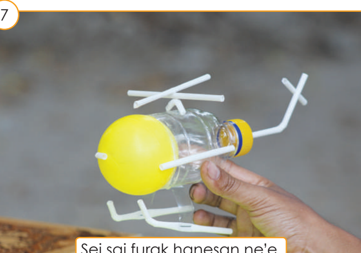
Sei sai furak hanesan ne'e.

NB: Karik sedotan laiha, imi bele uza aisanak ka du'ut nia sanak. No bola la iha, uza surat-tahan uzadu sira hodi halo bola no buat seluk ne'ebé nia modelu hanesan bola.