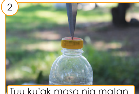
Tuu ku'ak masa nia matan hodi monta nia ikun.