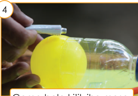
Goma bola ki'ik iha masa.