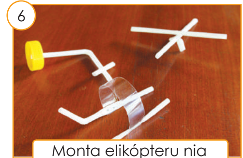
Monta elikópteru nia ain, ikun no ventuiña.