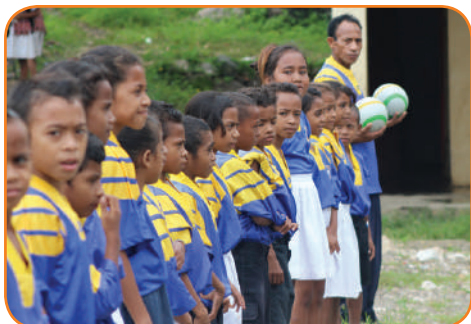
Edukasaun Fíziku, Páj.8