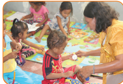
Fahe Esperiência, Páj.15