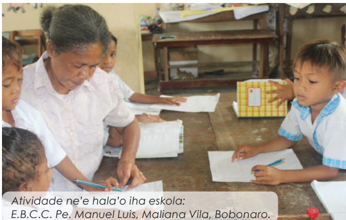
Atividade ne'e hala'o iha eskola: E.B.C.C. Pe. Manuel Luis, Maliana Vila, Bobonaro.

“Manorin tenke hatudu sira-nia sentimentu solidariedade iha prosesu aprendizajen. Ho ida ne'e, ita bele atinje ita hotu nia mehi atu hetan edukasaun ne'ebé ho kualidade aas no iha sustentabilidade.”