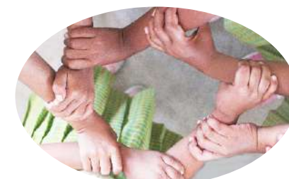
Saida maka pás Paj.14