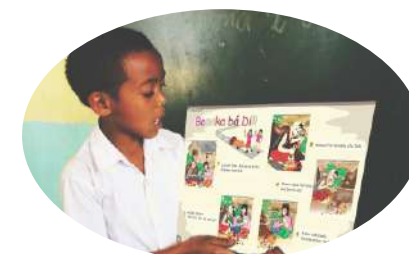
Aprendizajen Partisipativu, Paj.4-5