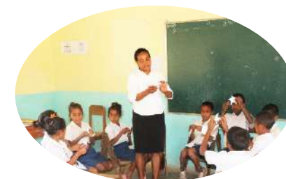
Fahe Esperíensia Paj.12-13