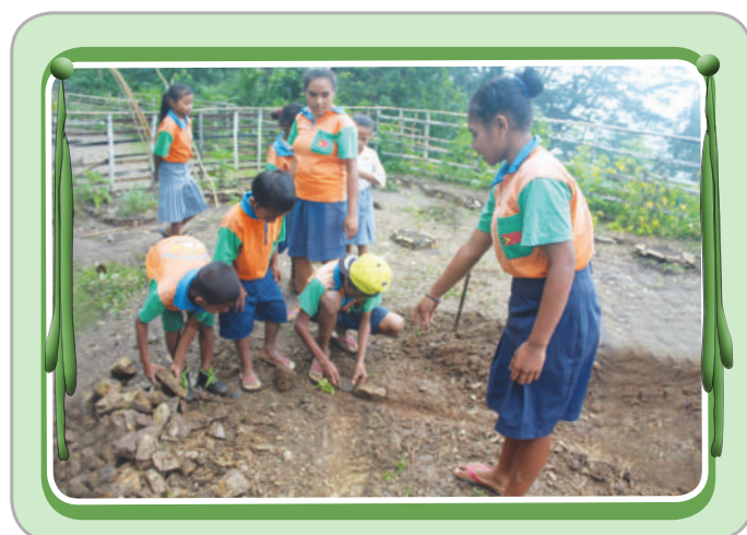
Atividade ne'e halo iha E.B.F 1.2 Asumano, Liquiça.

“Mai ita kria kantreiru modelu iha ita-nia eskola, atu nune'e ita bele aprende kuda modo no kuda ai-horis barak, no di'ak ba ambiente.”